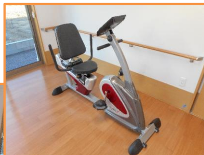
リカレントバイク