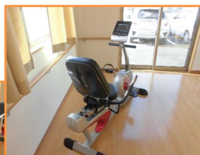
リカベンントバイク